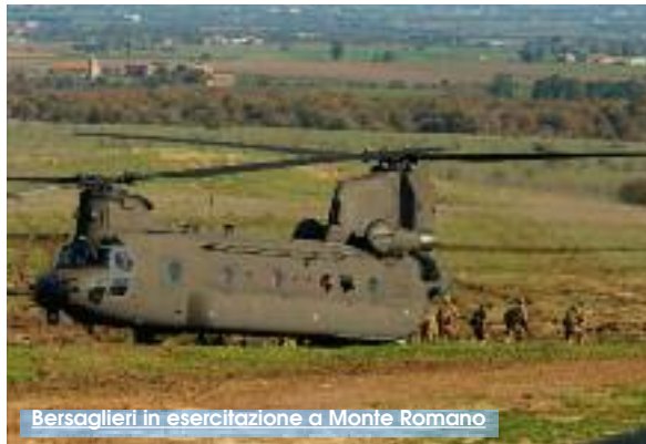
Bersaglieri in esercitazione a Monte Romano

esemplari di prototipi operativi del sistema individuale al combattimento. È stata amplificata la sinergia uomo-dotazione, in modo tale che ogni singolo soldato sia idoneo ad assolvere i compiti all'altezza dei profondi mutamenti intervenuti nello scenario internazionale, nell'ottica di un contesto d'impiego sempre più ampio. Si pensi alle missioni militari all'estero, in teatri di guerra, non con compiti di combattimento. I nostri bersaglieri trapanesi, per esempio, sono stati a lungo impiegati a Mosul, nella protezione dei lavori presso una diga in cui operavano ditte italiane. Il 6 Reggimento Bersaglieri di Trapani ha partecipato all'esercitazione con l'impiego del Veicolo Blindato Medio (VBM) "Freccia", al comando del colonnello Agostino Piccirillo. L'attività operativa ha consentito di sperimentare, durante l'esercitazione, sistemi d'arma ed equipaggiamenti ad alto indice