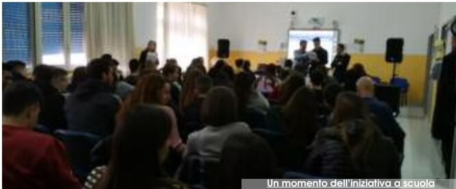
Un momento dell'iniziativa a scuola